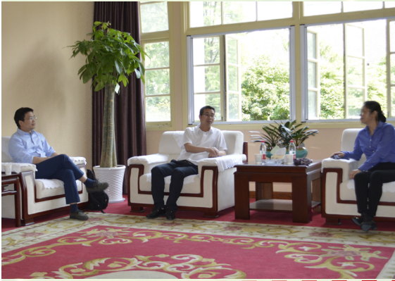
西南交通大学来校参观考察我院

2019年5月28日，西南交通大学科学技术发展研究院领导莅临我院考察，对校区的办学提出了肯定，并与我院领导探讨了联合办学的相关事宜。